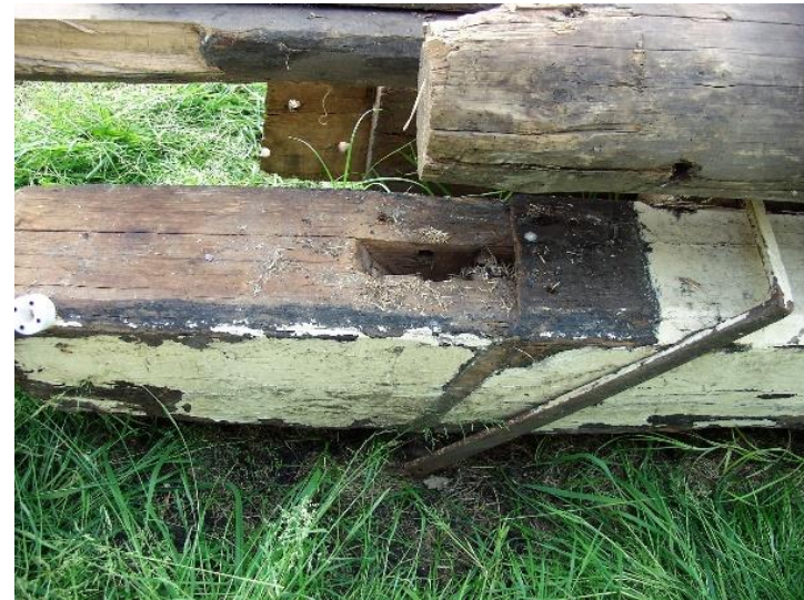
Het vroeg 18 de -eeuwse sleutelstuk overdekte het pengat van het korbeel in de grenen balk die kort na 1632 werd vervaardigd.

Helaas gaf de dikkere eiken ligger geen dendrochronologische uitkomst (boring 05 A). Het hout bleek afkomstig van een zeer snel gegroeide eik, zodat de balk ondanks zijn forse omvang van 22 x 28 cm slechts 29 jaarringen telde. Veel te weinig om een uitspaak over de leeftijd te kunnen doen. De lengte van ca. 6,20 m. maakt evenwel duidelijk dat dit een balk uit het hoofdgebouw moet zijn geweest. Aan het houtoppervlak is te zien dat de uiteinden tot ca. 39 cm. in een muur hebben gezeten. Veelzeggend, want dit betekent dat de muurdikte van het hoofdgebouw zo'n 50 tot 60 cm bedroeg. Daarmee komt het aardig in de buurt van wat in de vroege 15 de eeuw als een verdedigbaar steenhuis werd beschouwd. Het is een interessante vraag of er een link te maken valt tussen het Bottichiushuis en het 'hof' dat blijkens het voorkomen van de veldnaam 'hofakkers' in de directe nabijheid heeft gestaan. 6