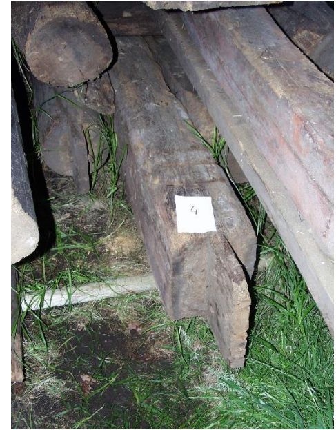
Grenen balk uit ca. 1620.