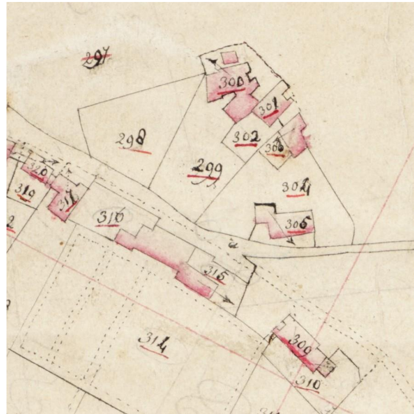
De kadastrale minuut uit 1832 (in kaart gebracht rond 1812) met het Bottichiushuis (nr. 315) ter hoogte van het huidige adres Kruisstraat 26. 1

Klingers Bouwhistorie & Restauratie Beilerweg 4 9418 Wijster 06-41373813 www.klingersbouwhistorie.nl jimklingers@hotmail.com