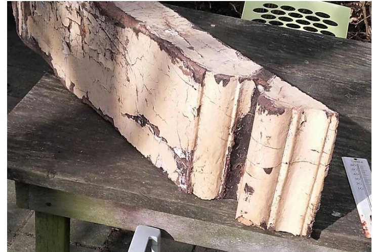
Eiken sleutelstuk uit 1716.