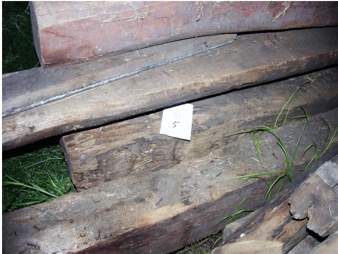
Eiken balk van onbekende leeftijd.