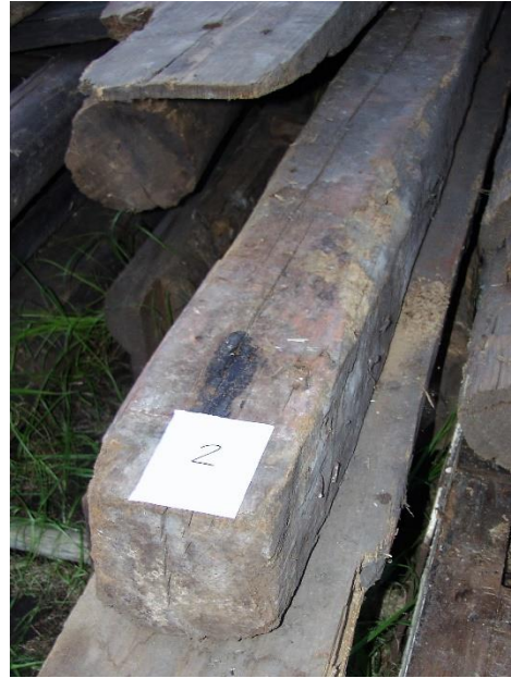
Eiken balk uit ca. 1422.