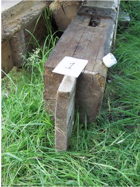
Grenen balk uit 1632.